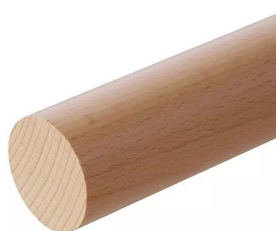
Beuk Vernist (PS03BV)