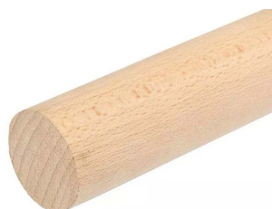
Beuk Natuur (PS03BN)