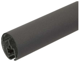
Alu Antraciet (31PA04)