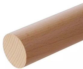
Beuk Vernist (PS03BV)