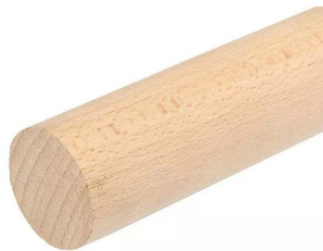
Beuk Natuur (PS03BN)